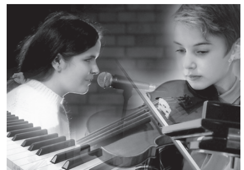
yoho Musikalisches Rahmenprogramm